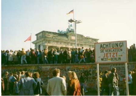
Brandenburger Tor, 1989

„Wir feiern zwei Jubiläen – Vor 70 Jahren erfand Stalin die Blockade Berlins. Die Alliierten beantworteten sie mit der Luftbrücke. Es waren harte Zeiten für alle Beteiligten. Worum ging es eigentlich? Vor 30 Jahren fiel die Berliner Mauer. Ein Ereignis, das weltweit mit viel Emotion wahrgenommen wurde. Es war ein Moment des Glücks für alle Beteiligten. Warum eigentlich fiel die Mauer? Dass Geschichte äußerst unterhaltsam sein kann, werde ich Ihnen mit dieser Tour beweisen. Auf unserer entspannten Fahrt durch die Stadt werden wir auch einen Ort finden um einen Kaffee zu trinken.“