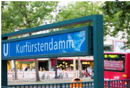
Eingang zum U-Bahnhof Kurfürstendamm

„Diese Tour führt nach Charlottenburg, vermittelt einen Eindruck von der Entwicklung des früheren Zentrums von Westberlin und weist auf einige Straßen hin, wo sich seit kurzem durch Eröffnung neuer Restaurants und Bars auch am Abend globalerer Kiezflair erleben lässt.“