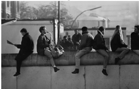
J6YJWY Berlin @Foto: Brian Harris/ Alamy Stock Photo

„Während unserer Tour durch das geteilte Berlin, das bis zum Mauerfall im November 1989 die Frontstadt des Kalten Krieges war, werden wir auf den Spuren des Ost-West Konflikts Überreste der Berliner Mauer sehen, geschichtsträchtige Orte besuchen und spannende Geschichten hören. Geschichten von Personen die durch die Mauer von ihren Familien getrennt wurden oder die geflohen sind. Sie werden auch etwas über die Folgen der 28-jährigen Trennung der Stadt, die positive Entwicklung Berlins seit dem Mauerfall und die Bedeutung der Mauer für die heutigen Bewohner erfahren.“